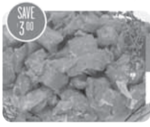
Beef Pastrami Kretschmar